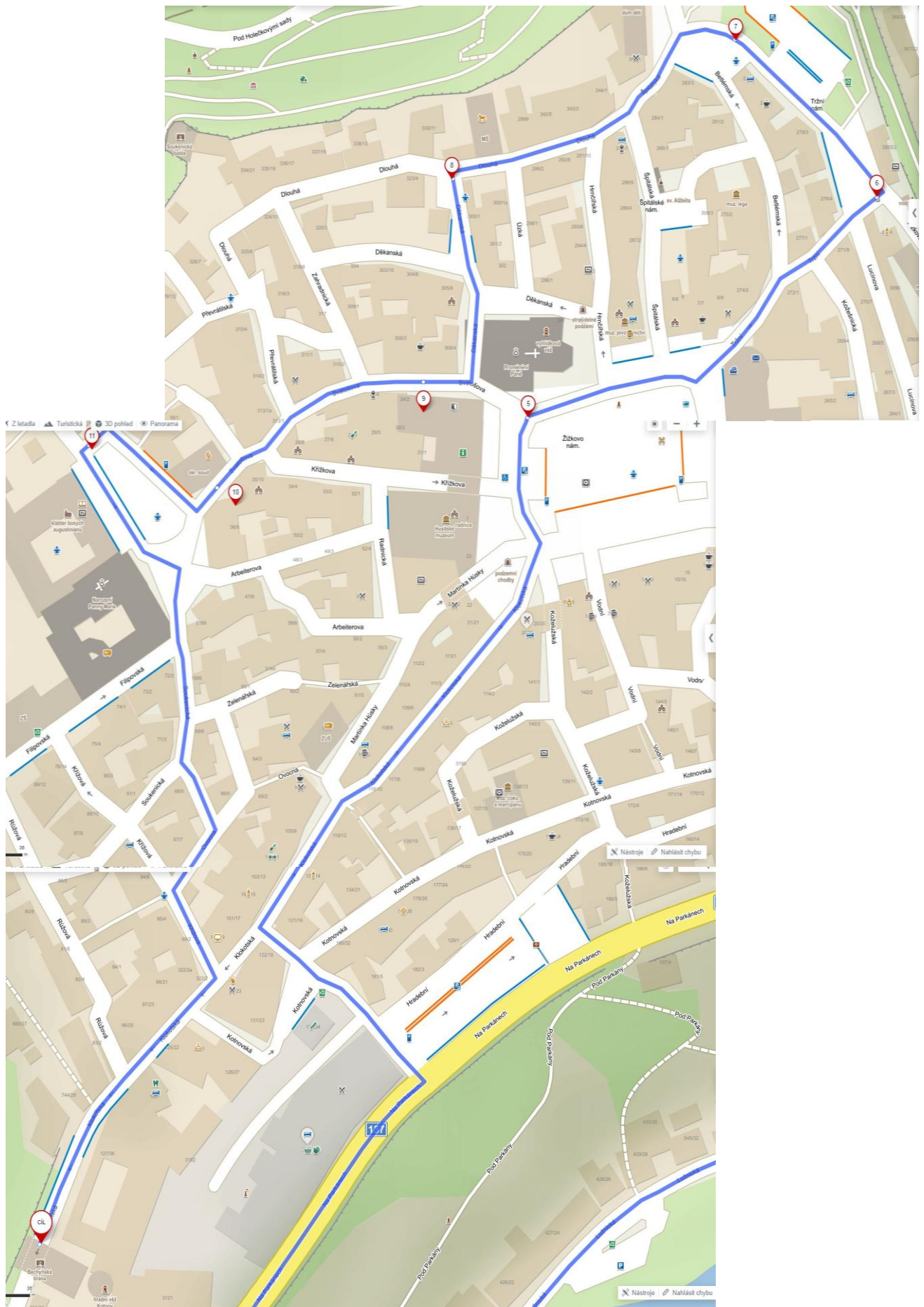
detail průjezdu historickým centrem